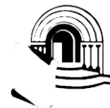
Parròquia de Sant Mateu