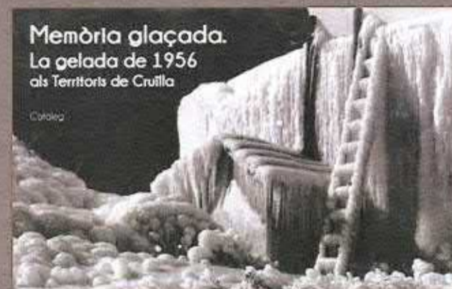
Memòria glaçada. La gelada de 1956 als Territoris de Cruïlla

Lloc: Sala d'Exposicions de l'Ajuntament de St Mateu