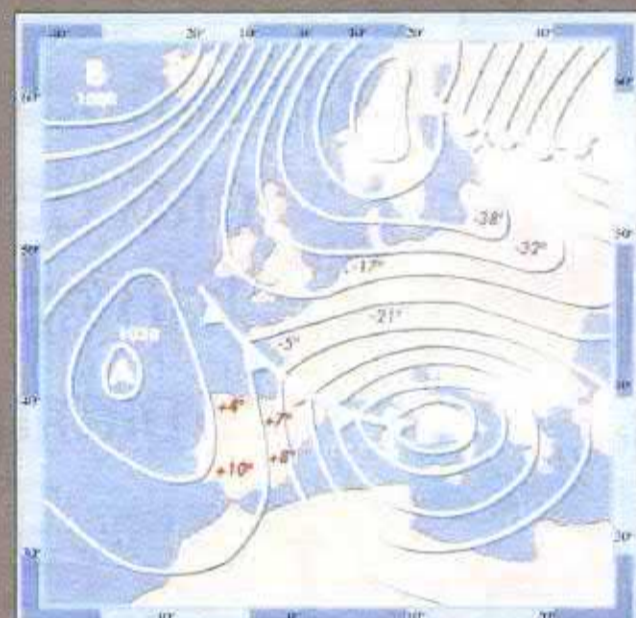
Situació meteorològica a las 6:00 h del 1 de febrero de 1956. Es interesante observar los bajos valores de temperatura, que muestran como la masa de aire frío continental está limitada por el frente frío a bajas latitudes y por uno caliente hacia la latitud de 60°