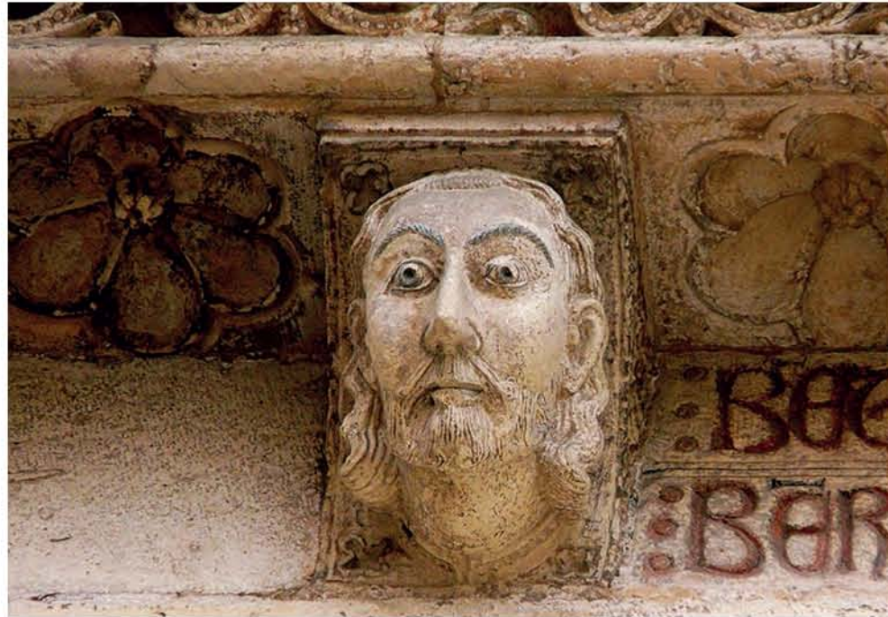
Valencia, Porta de l'Almoína.

Esta ruta une los territorios del Midi francés, Catalunya y Aragón con la Comunitat Valenciana y nos permite revivir un importante episodio de nuestra historia y la experiencia de quienes tuvieron que huir de sus tierras en busca de una nueva vida y de la libertad.