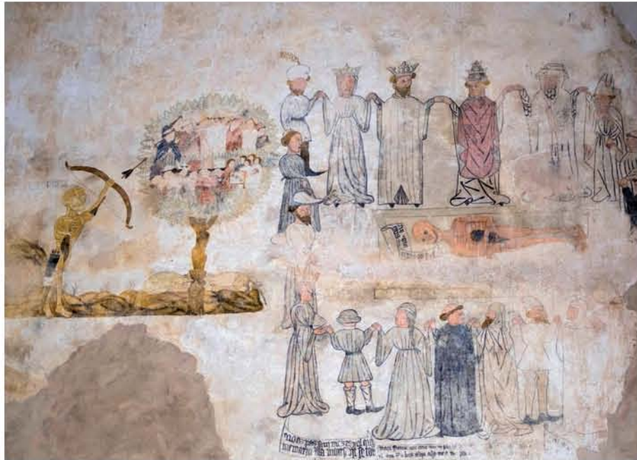
Dansa de la Mort. Convent de Sant Francesc de Morella (Castellón).