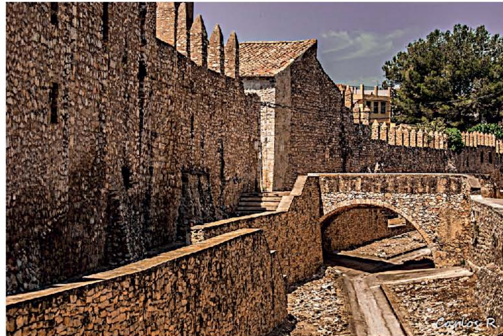
Muralla de Sant Mateu (Castellón)

Esta ruta desde el Midi francés hacia el sur, utilizó las históricas calzadas romanas, caminos medievales y, sobre todo, los caminos de trashumancia ganadera que fueron utilizados para sus desplazamientos. Una visita a diversas localidades dels Ports y del Maestrat, como Morella o Sant Mateu nos permitirá observar el legado de aquellos cátaros que se asentaron en estas tierras.